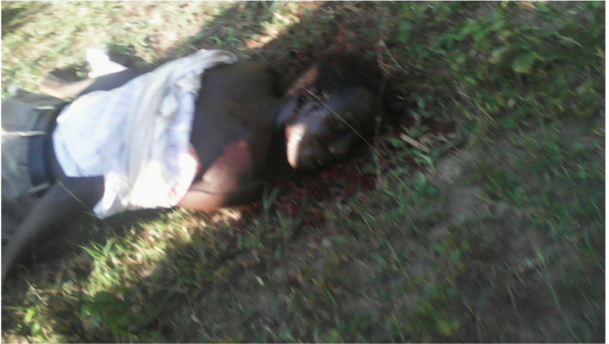
Un corps sans vie non identifié qui a été découvert dans la matinée du 9/6/2016, en province Bubanza , commune Gihanga , zone Buringa, colline Buringa dans un endroit appelé communément « Rukoko », derrière des champs de riz.