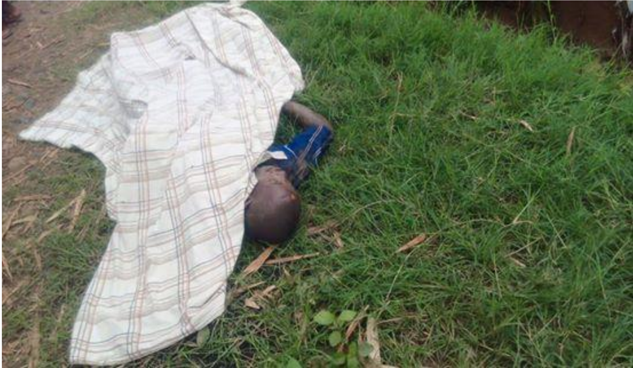
Un cadavre retrouvé en commune Ntawangwa , zone Cibitoke 16 ième dans la rivière Nyabagere dans la matinée du 30/10/2015.