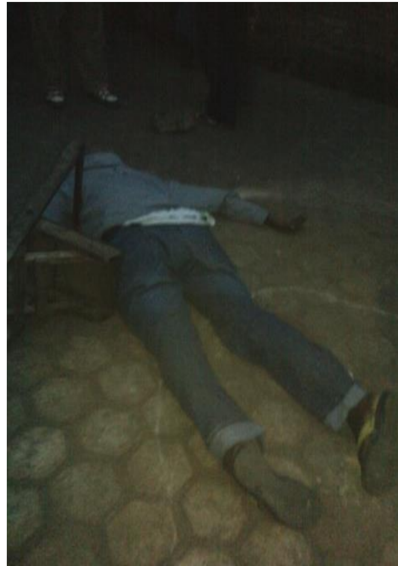
Photos de deux personnes qui ont été fusillées en commune urbaine de Ntakangwa, zone Gihosha dans une parcelle du docteur Rwajekera, le soir du 14/7/2016, vers 19h