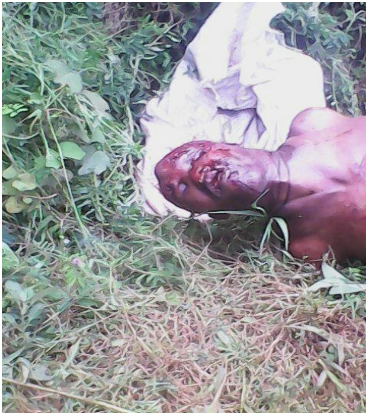
Photo du corps sans vie non identifié qui a été découvert , découpé en morceau et emballé dans un sac en province Bujumbura rural , commune isale , dans la matinée du 30/4/2016.