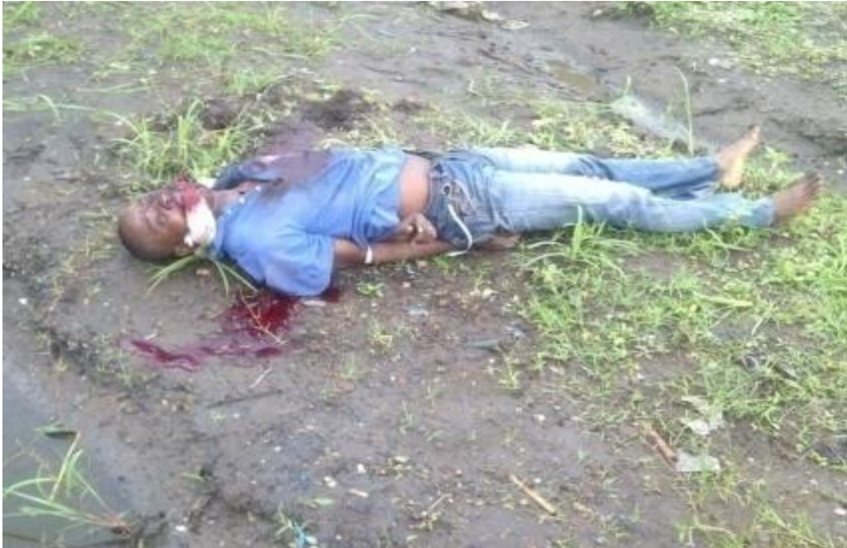
Cette corps sans vie non identifié a été retrouvé en zone cibitoke 9 ème avenue dans la matinée du 30/11/2015.