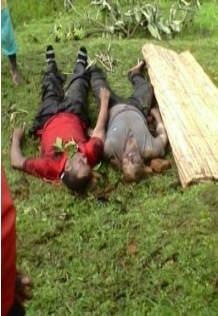
Les corps de deux militaire déserteurs tués en province Muramvya zone Ryarusera en date du 13/1/2016