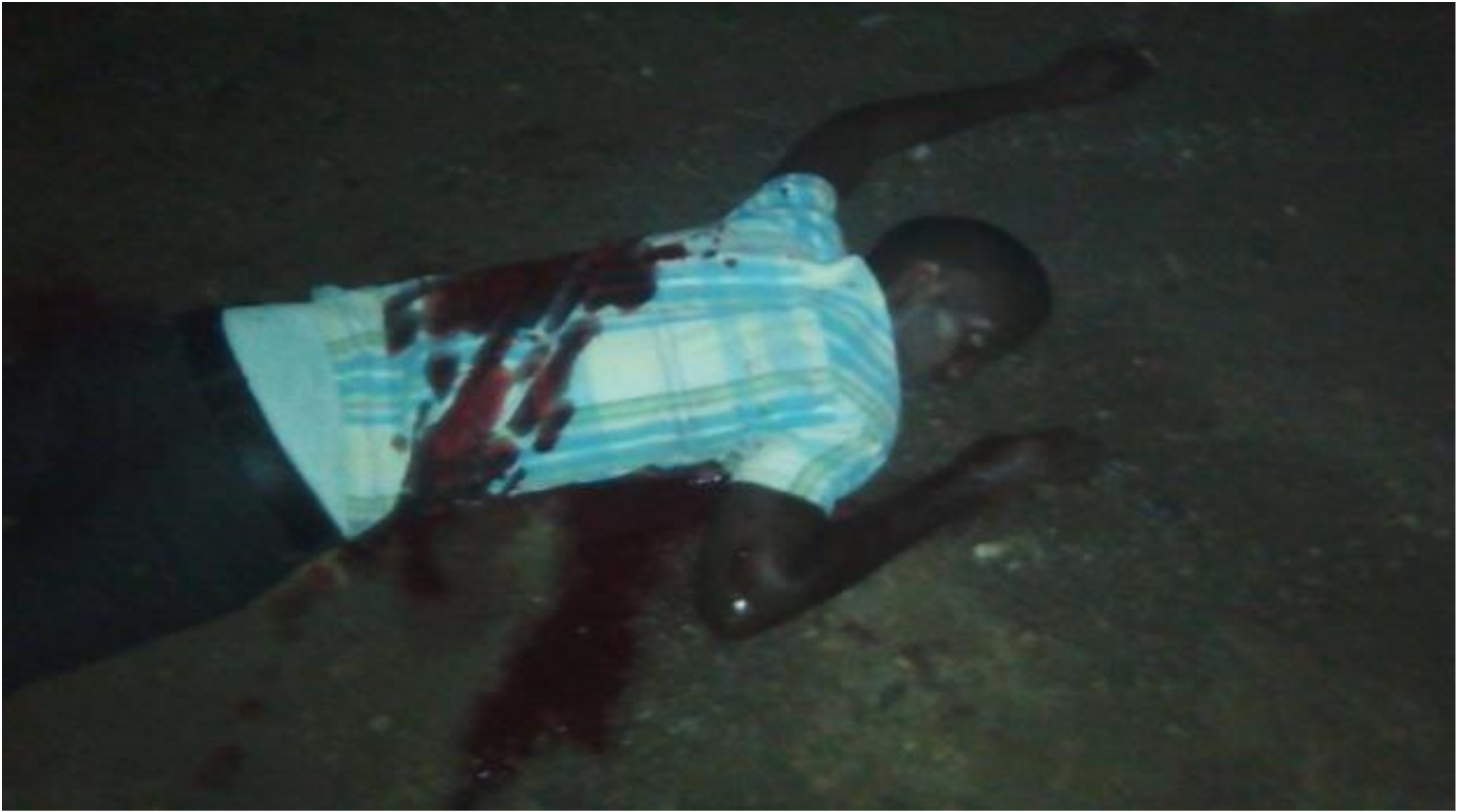
Photo de l'un parmi les deux qui ont été fusillés en zone Kanyosha quartier Kajiji dans un bar communément appelé « King bar » dans la nuit du 30/4 au 1/5/2016.