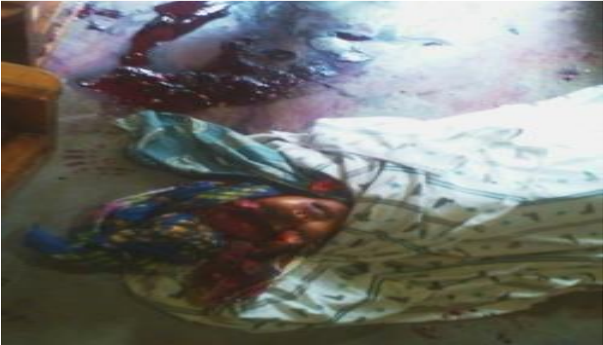
Une photo d'une dame prénommé NIZIGAMA Anita qui a été assassiné dans la nuit du 12 au 13/6/2016 en commune urbaine de Muha , zone Musaga , à la 1 ière avenue.