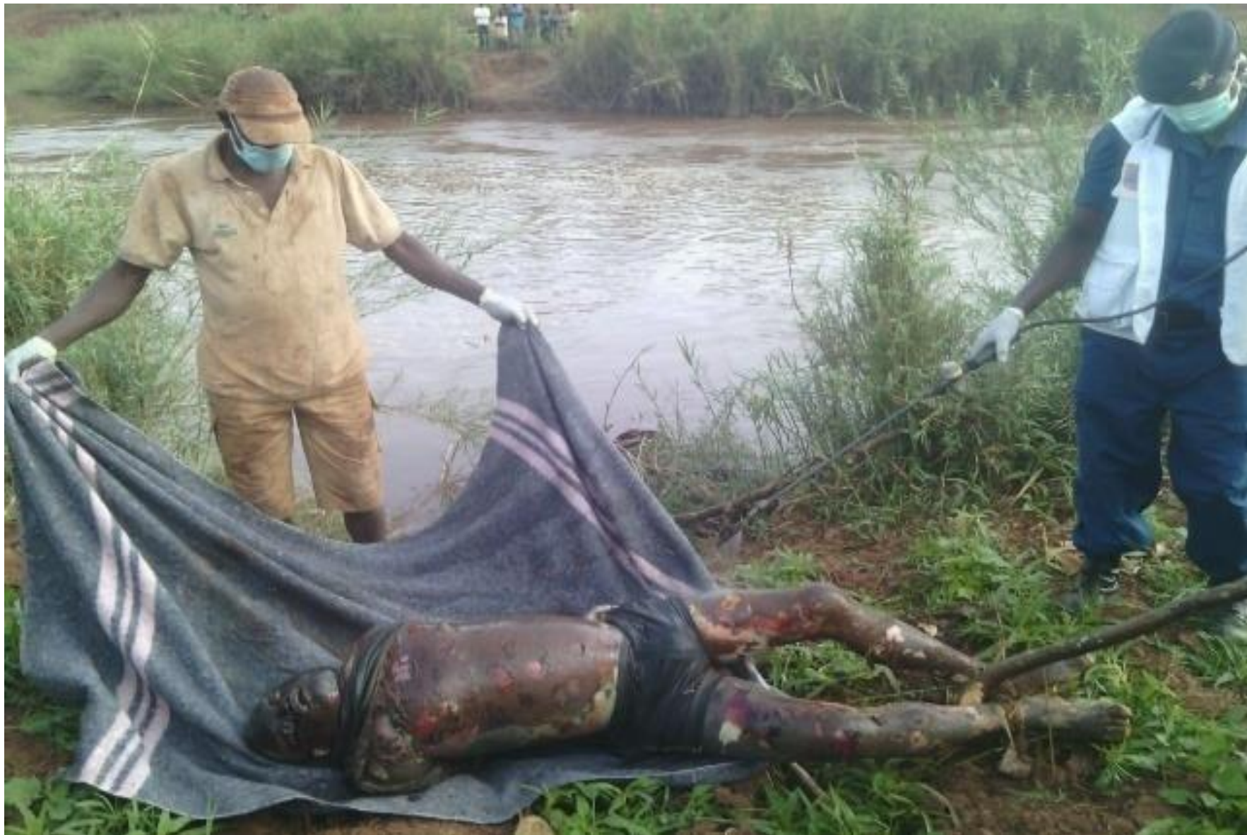
Ce corps sans vie d'un homme nom identifié qui a été découvert dans la rivière Ruyironza en province et commune Gitega en date du 9/8/201.