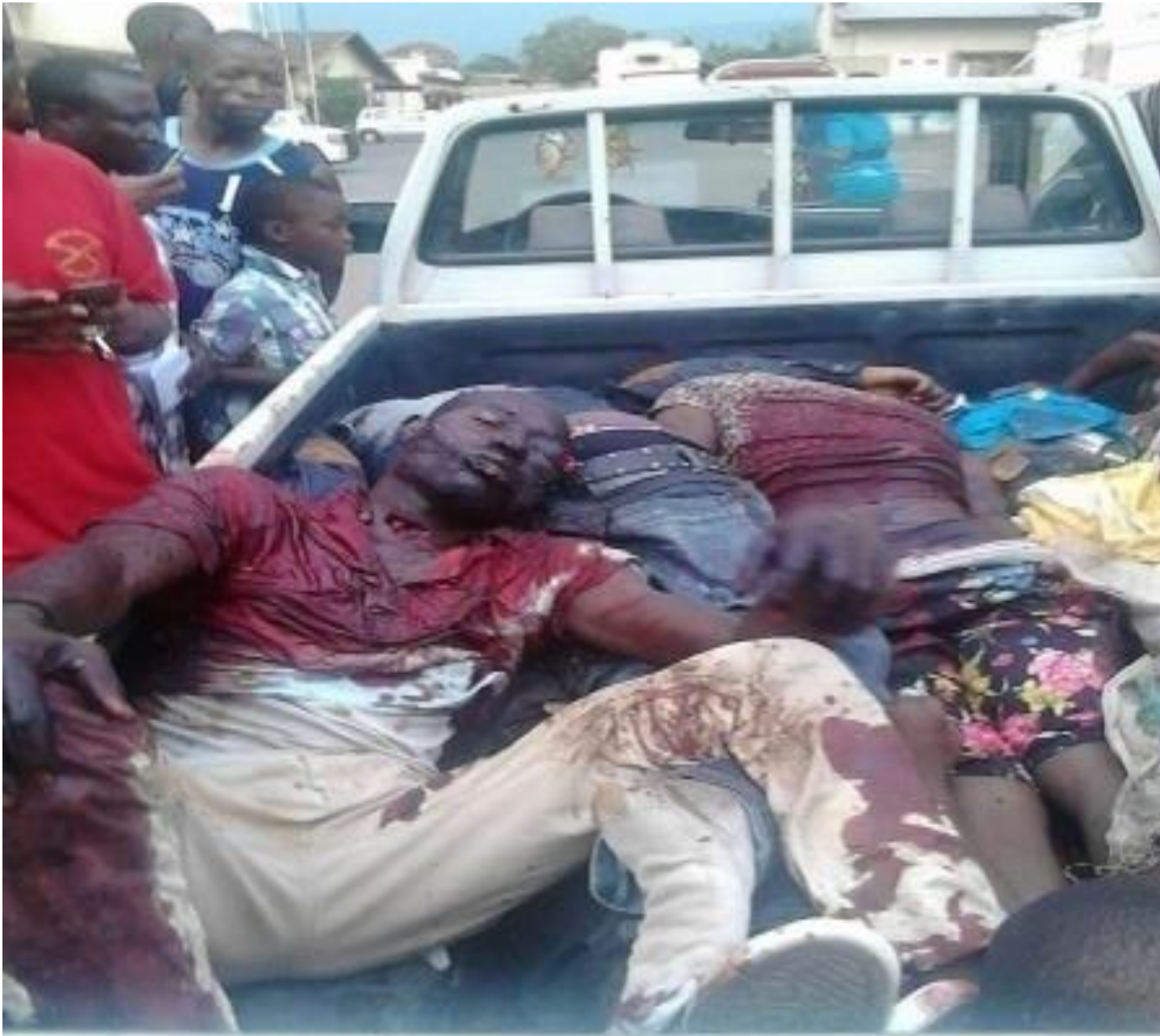
Les cambrioleurs de la BCB (agence Buyenzi) fusillés en date du 9/10/2015 en commune urbaine de Muha , zone Rohero , en pleine ville de Bujumbura