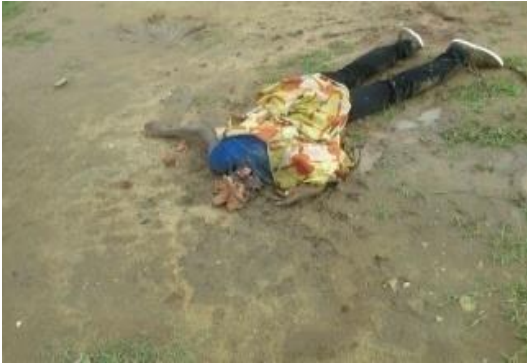
Cette corps sans vie a été retrouvé décapité en zone Buterere dans la matinée du 5/11/2015.