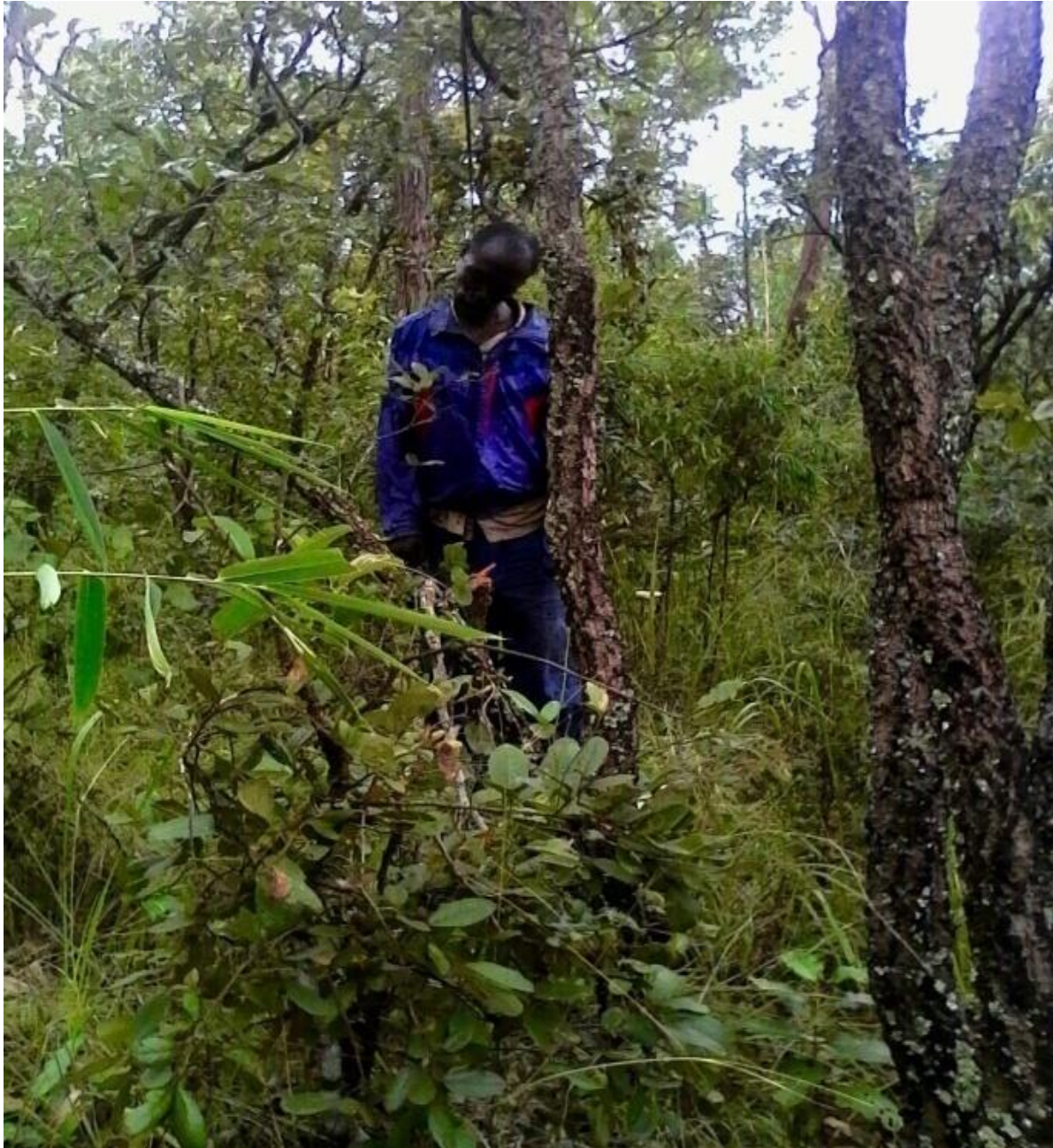
photo du corps sans vie pendu de NSHIMIYE , un rwandais de la site de Butare en province Rutana , il a été découvert en commune Bukemba en date du 14/4/2016.