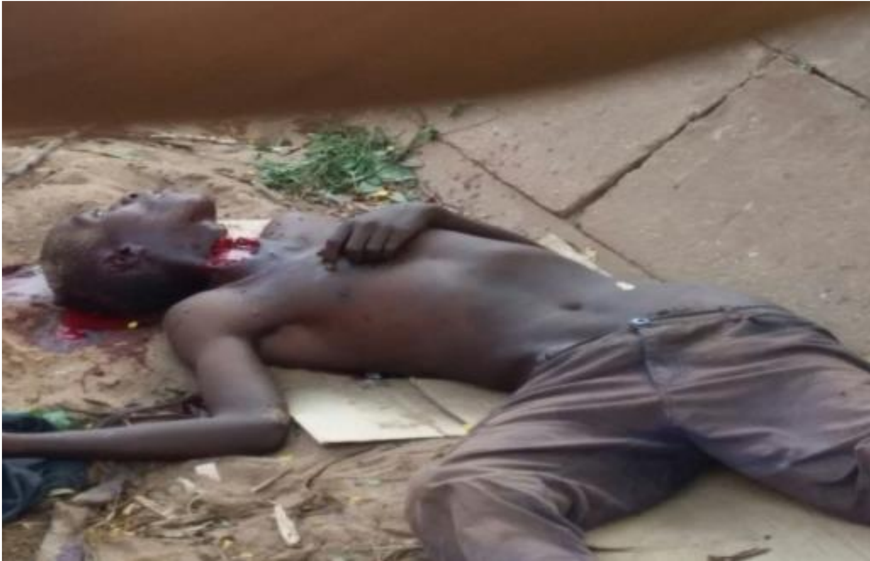
Ce cadavre a été retrouvé décapité près du Lycée notre dame de Rohero en commune urbaine de Mukaza, zone Rohero en date du 30/1/2016.