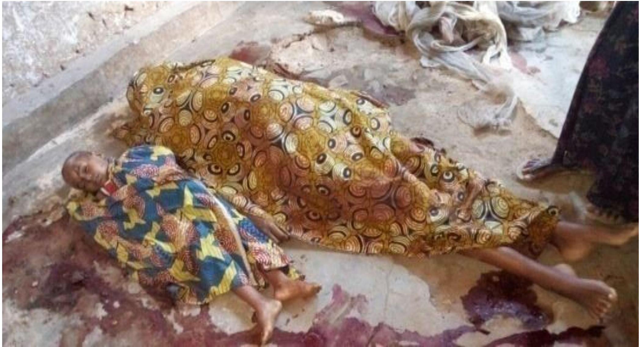
Les corps sans vie parmi les 5 personnes qui ont été fusillées en commune urbaine de Muha zone Musaga, 3 ème avenue, quartier Gitaramuka dans la nuit du 28 au 29/4/2016.