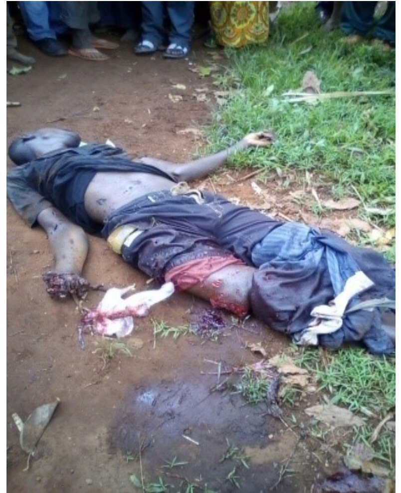
Cet homme non identifié a été tué à la grenade en province Karusi, commune Gihogazi, sur la colline Kizingoma en date du 8/3/2017.