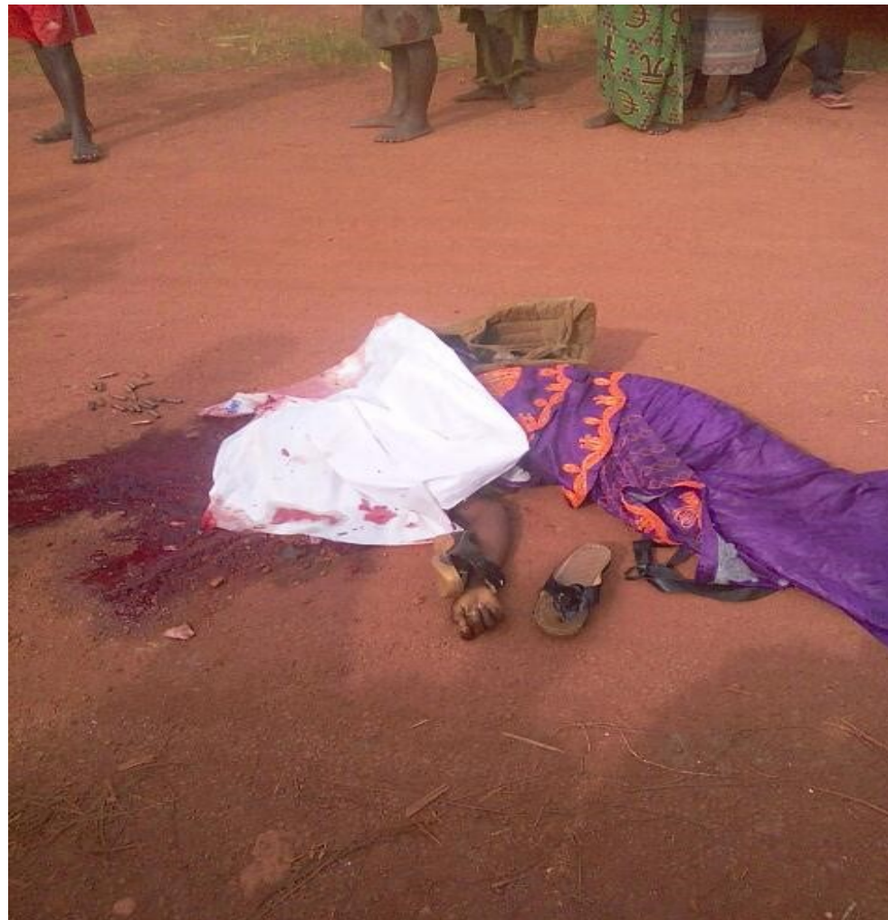
Cette dame a été fusillée par son amant policier en date du 14/4/2017, en province de Bubanza, commune de Rugazi